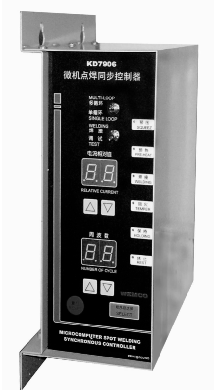
图一、KD7906S 型控制器外形

本控制器的高度集成化,尤其是 1°C 总线 and 数字显示技术的应用,使得电路十分简洁。这不仅便于产品的调整、维护和保养。